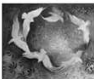
Autorka karice: Biljana Došlić, Pančevo

BLAGO ONOME, KOME JE OPROŠTENA KRIVICA, KOME JE GRIJEH POKRIVEN. PSALAM 32:1