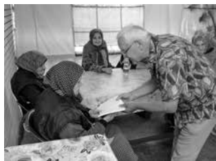
Starački dom u Negotinu