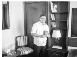
Hotel u Subotici