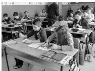
Škola u Adi